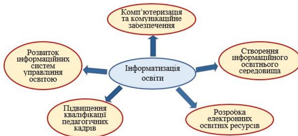
Рис. 1. Складові інформатизації освіти

Одним із найважливіших завдань вищої школи є найбільш повне розкриття інтелектуального потенціалу слухачів, їх здібностей генерувати та сприймати нові знання, формування умінь застосовувати їх у своїй повсякденній та професійній діяльності, використовуючи сучасні інформаційні методи та засоби. Це завдання, а саме впровадження освітніх інновацій, зокрема інформаційних технологій, серед інших пріоритетних напрямів державної політики, поставлене в національній доктрині розвитку освіти. Визначальним чинником ефективності інформатизації вітчизняної системи освіти є здатність педагогів здійснювати професійну діяльність із використанням інформаційних та телекомунікаційних технологій (рис. 1).