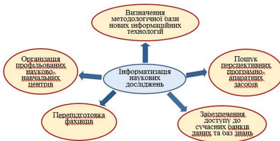
Рис. 2. Завдання інформатизації науково-дослідної діяльності

Щодо інформатизації наукових досліджень, які проводяться аспірантами, слід зазначити, що інформаційні технології відіграють ключову роль у процесі накопичення, поширення та ефективного використання нових знань (рис. 2).