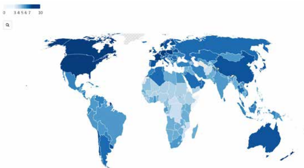
Рис. 2. Індекс продовольчої безпеки за загальним балом [14]

Також звернемо увагу на карту, на якій способом якісного фону зображено Глобальний індекс продовольчої безпеки за загальним результатом станом на 2022 рік (Рис. 2).