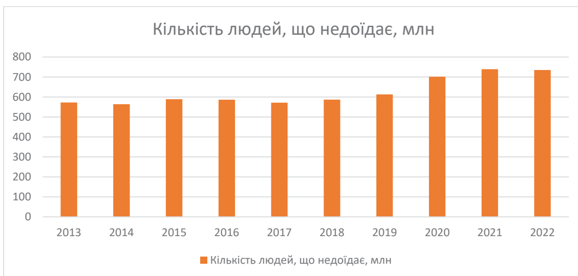
Рис. 1. Кількість людей, що недоїдає, млн (2013–2022) [7]

Спираючись на актуальні статистичні дані, графічно представимо прояви проблеми голоду на глобальному рівні, згідно з даними Продовольчої і сільськогосподарської організації ООН (FAO) (Рис. 1).