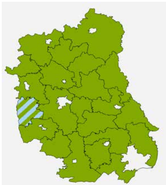
Рис. 1. Локальні групи у Люблінському воєводстві (Польща) [7].

мешканців, які діють на благо місцевої громади. У Польщі зареєстровано і успішно діють 324 ЛГД, чії стратегії місцевого розвитку були обрані для впровадження та фінансування з Програми розвитку села на 2014–2020 роки в рамках заходів програми LEADER [7].