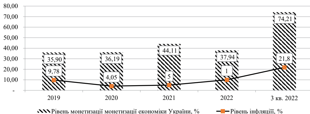
Рис. 1. Динаміка рівня інфляції та монетизації економіки за агрегатом МЗ в Україні на 01.01.2019 – 3 кв. 2022 рр., %

Проведемо оцінку змін рівня інфляції та коефіцієнту монетизації станом за 2019 – 3 квартал 2022 рр., на початок періоду (рис. 1).