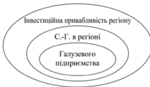
Рис. 2. Середовище формування інвестиційного клімату в сільському господарстві регіону

Надзвичайно великий вплив на формування інвестиційного клімату окремих територій регіону має естетичний стан населених пунктів, культура землеробства, екологічний стан території, розвиненість ринкової інфраструктури, ділова активність місцевого населення, наявність трудових ресурсів, функціонування кооперативних та інтегрованих виробничих структур.